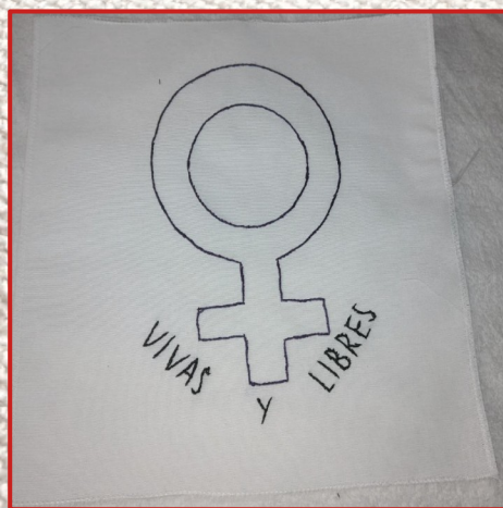
Montse Quintà Duñach