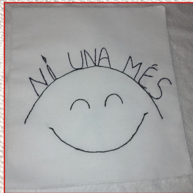
Montse Quintà Duñach