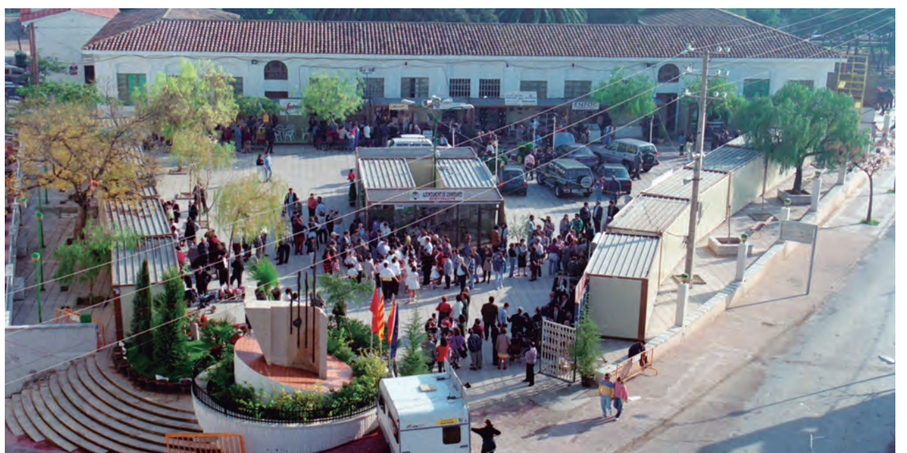
Imatge de la Plaça de les Escoles Velles a la Fira de 1994.

En edicions recents es van fer noves iniciatives que costa consolidar. L'equip actual del govern li està donant el gir necessari per tal d'actualitzar-la als nostres dies.