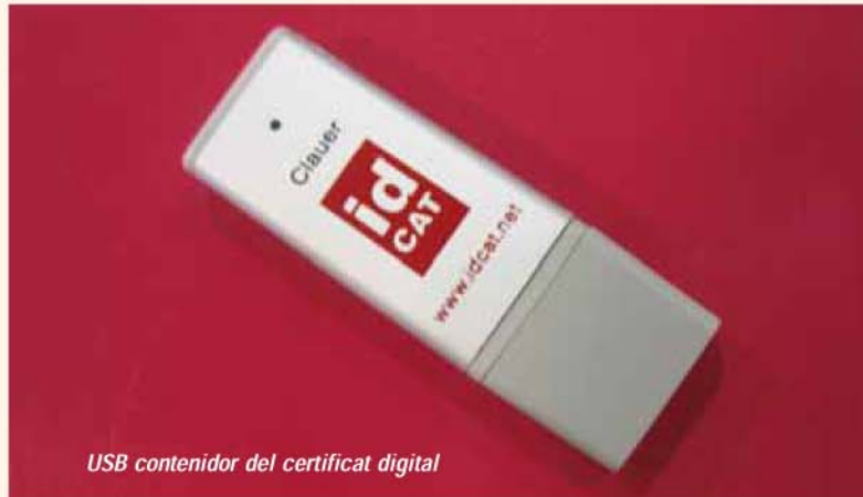
USB contenidor del certificat digital

Amb l'ús d'aquesta eina, s'ampliarà el nombre de gestions disponibles. D'aquesta manera, durant els anys 2009 i 2010 es preveu que la carpeta permeti veure, entre d'altres coses, l'estat dels expedients de la persona usuària, iniciar expedients deixant constància al registre telemàtic,