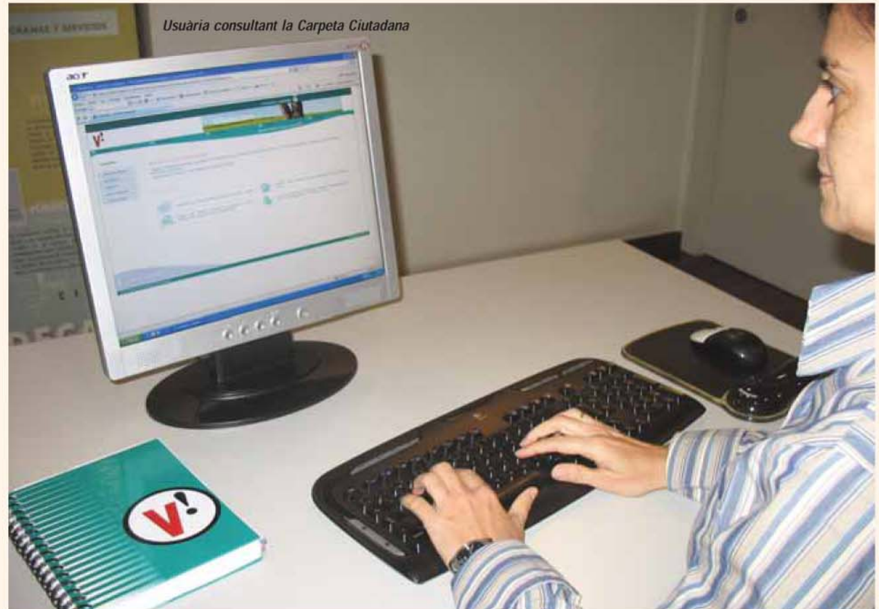
Usuària consultant la Carpeta Ciutadana